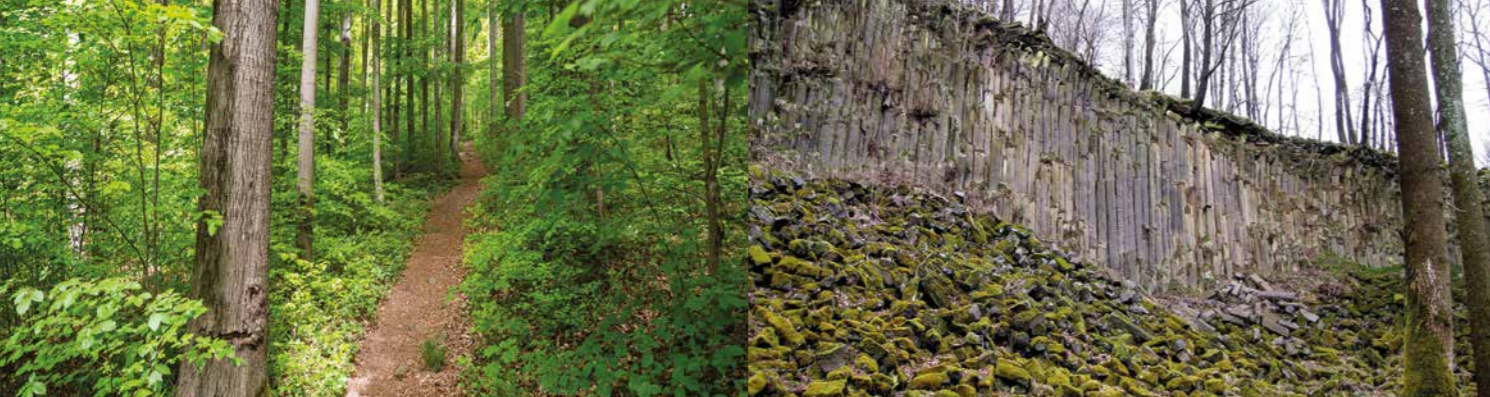
Säulenbruch am Geiskopf