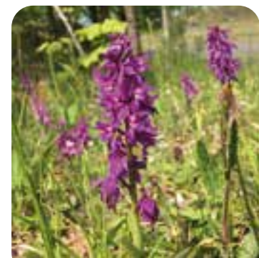
Die Orchidee Stattliches Knabenkraut gedeiht am Oechsenberg

An der Paulinenquelle ⑤ kann man sich kurz erfrischen, bevor sich das historische „Eselspfädchen“ steil bergauf schlängelt. Auf dem unteren Plateau angekommen, bietet sich eine herrliche