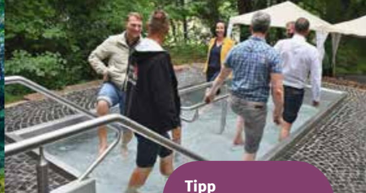
Kneippen in Wölferbütt