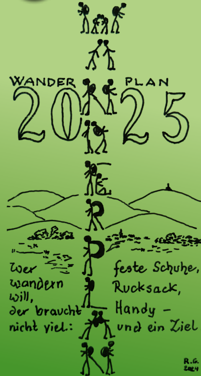
Inhalt: Vorstand, Design: Katrin Jörk | www.art-word.de